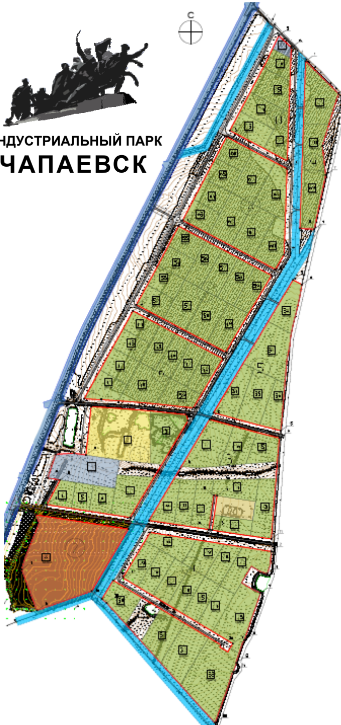
ИНДУСТРИАЛЬНЫЙ ПАРК ЧАПАЕВСК